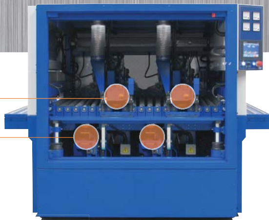
MB4 maquinas con 4 grupos operadores (dos superiores + dos inferiores)