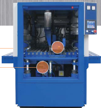
MB2 maquinas con 2 grupos operadores (uno superior + uno inferior)