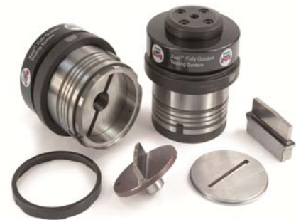
Above: Mate's Xcel™ Fully-Guided Slitting System for Strippit Style Thin Turret punch presses.

Obtener el máximo rendimiento con su Herramienta de Corte, puede reducir drásticamente los costes en herramientas e incrementar los procesos productivos. A continuación les daremos unos consejos para incrementar el rendimiento de sus Utilajes de Corte.